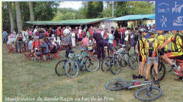
Manifestation du Rando-Razès au Lac de la Pène

Chargée d'histoire, la commune se situe à une place stratégique de la région. Dominant la vallée de l'Ambronne elle pouvait, grâce au château de Labastide d'Enrichard (domaine privé) contrôler les accès de la vallée vers Limoux, Mirepoix et l'accès vers le Razès. Les terres agricoles organisées harmonieusement en étages permettent de perpétuer une activité rurale équilibrée.